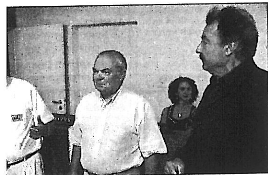
à droite) reçu par les élus

• Exposition Manfred J. Nittbaur, hall de la mairie, Les Sables d'Olonne.